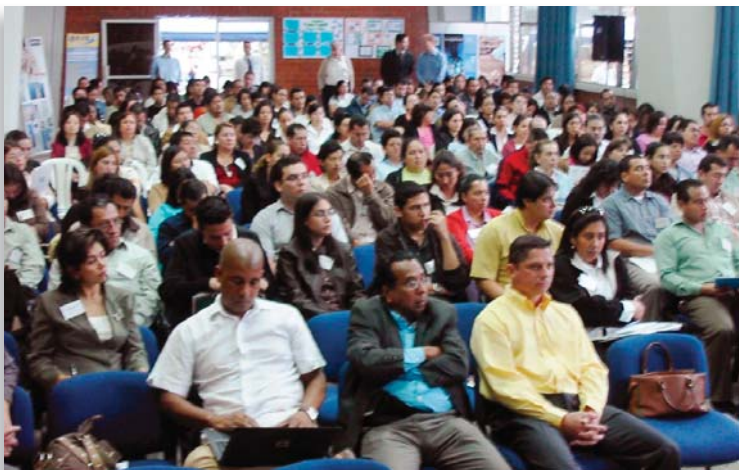
Asistentes al Congreso

de proveedores y laboratorios, quienes presentaron en stands comerciales equipos, materiales de referencia, servicios analíticos de laboratorios, mantenimiento y calibración de equipos, entre otros.