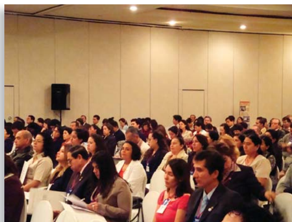
Participantes del Congreso Nacional de la Calidad 2008.