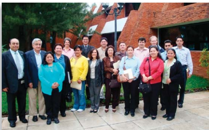
Participantes de la VI reunión.

En el mes de septiembre, la OGA organizó la VI reunión de evaluadores con el fin de mantener la comunicación periódica con los evaluadores y actualizarlos respecto a los criterios y políticas de la Oficina.