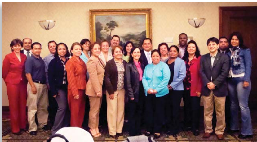
Participantes del curso centroamericano sobre la norma ISO 15189.